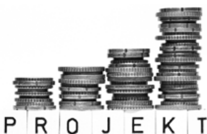
Keine neuen überkantonalen Bildungsprojekte, wenn das dafür notwendige Geld fehlt.

«Unantastbare» Posten sollen nicht durch immer grössere Einsparungen auf anderen Schulstufen kompensiert werden.