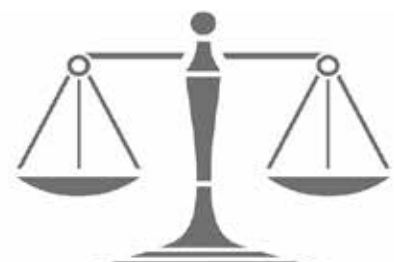
Dem Verursacherprinzip soll mehr Rechnung getragen werden.