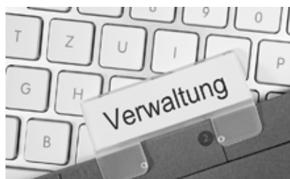
Können Sparmassnahmen nicht verhindert werden, muss auch die Verwaltung ihren Sparanteil leisten.