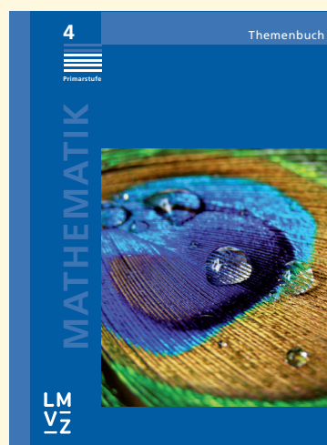
Das Cover des Themenbuches «Mathematik 4 Primarstufe».

www.lmvz.ch/schule/mathematik-primarstufe